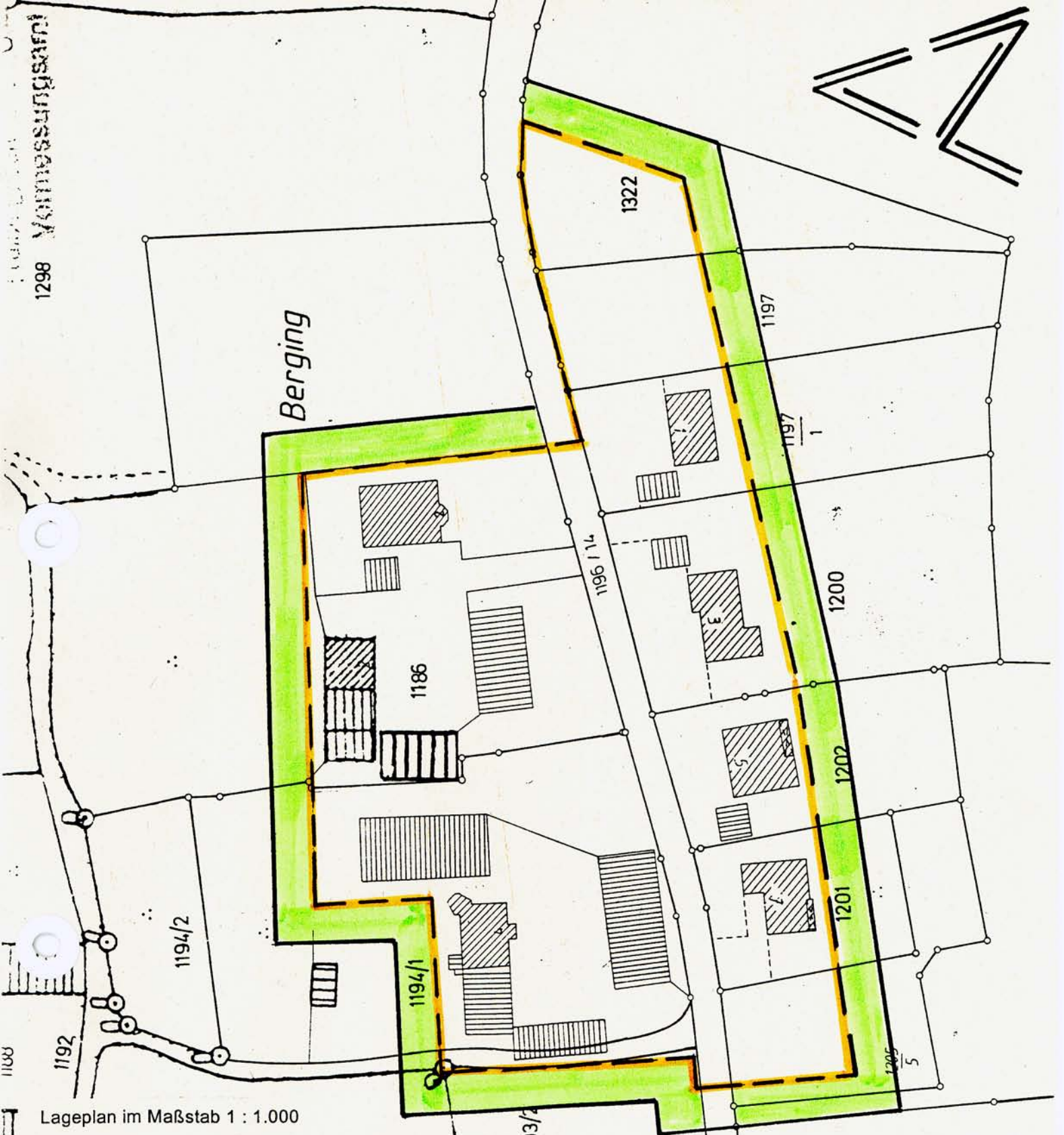
Lageplan im Maßstab 1 : 1.000