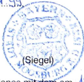
Neumaier Erster Bürgermeister